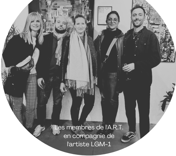
Les membres de l'A.R.T. en compagnie de l'artiste LGM-1

Un espace sécurisé permettant la création, la rencontre, l'échange, la réalisation de soi.